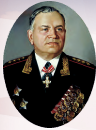
Генерал армии А.В. Хрулёв

Военная орденов Кутузова и Ленина академия материально-технического обеспечения имени генерала армии А.В. Хрулёва Министерства обороны Российской Федерации прошла большой и славный путь своего становления и развития. Она ведет свою историю с 31 марта 1900 года, когда в столице России – Петербурге впервые в мире было создано специальное военно-учебное заведение тыла – Интендантский Курс для подготовки офицеров и чиновников интендантского ведомства.